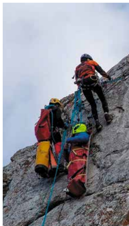
Соревнования по спортивному туризму с. Аромашево